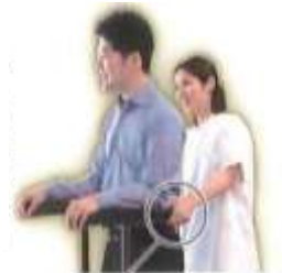
ひじの後ろから補助ができます

3. 補助しやすい 介助者と歩行器の距離が近いので、後方からの介助が楽に行えます。