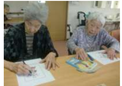
皆さんで塗り絵。 綺麗に仕上がりました!