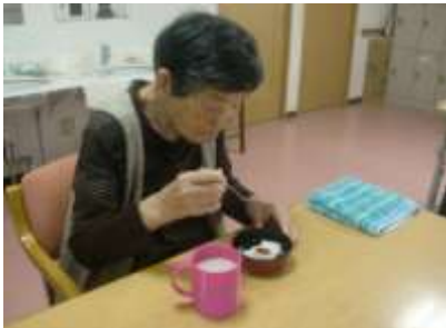
職員手作りの寒天を 皆さんで食べました♪