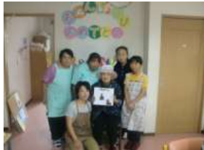
誕生日会を行いました! 職員と記念撮影 (b≧v)