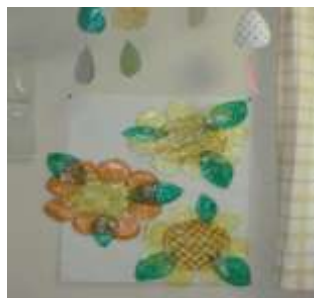
季節の作品作りを行いました(*^_^*) 緩衝材を再利用!!