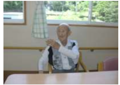
皆さんで元気よく 体操を行いました(^o^)/